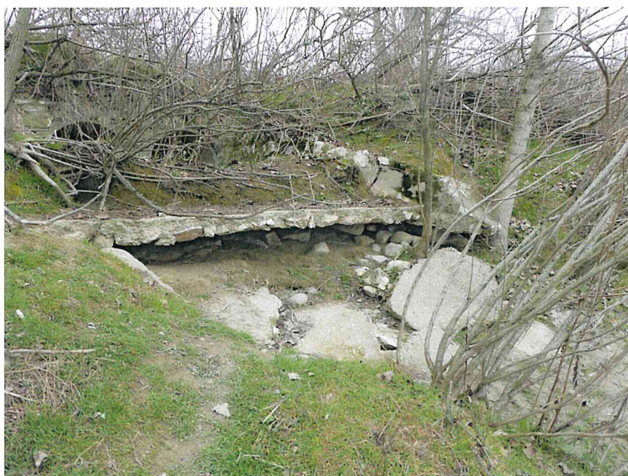
Foto 4: particolare dello scarico coinvolto nel dissesto spondale della curva n. 25